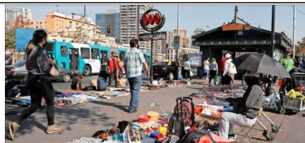
AMBULANTES. — En el sector de Mapocho, durante los últimos días se concentraron los puestos informales. Expertos advierten que es necesario incrementar la fiscalización.

Advierte que es necesario ayudar económicamente a las familias para que no se vean impulsadas a vender en la calle. Sin embargo, separado por una calle,